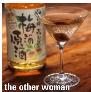
the other woman

shochu japonês, xarope simples, limão, clara, togarashi - 36