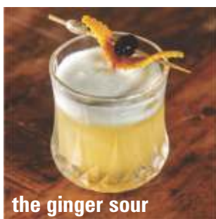
the ginger sour

scotch, xarope de gengibre, limão, clara, angostura bitter - 34