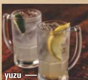
yuzu — chuhai

shochu japonês, xarope de gengibre, limão, bitter de grapefruit, espumante - 36