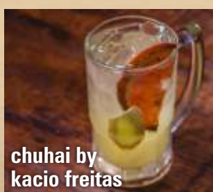
chuhai by kacio Freitas

shochu japonês, xarope de gengibre, limão, bitter de grapefruit, espumante - 36